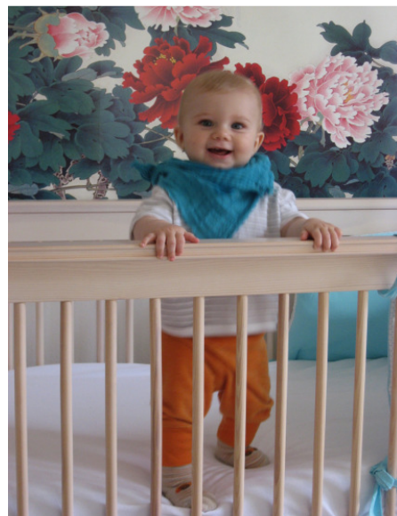
Unterstützen Sie Ihr Kind mit einem typgerechten Kinderzimmer

Die chinesische Astrologie bietet die Möglichkeit, das Kind besser zu verstehen. Sie gibt Anhaltspunkte betreffend Typus des Kindes. Basierend auf der Fünf-Elemente-Lehre kann man das Kind in seiner Entwicklung unterstützen. Ist der Typus erst einmal ermittelt, kann man das Zimmer und auch die Ernährung auf sein Kind zuschneiden und ihm so Gutes tun. Bekommt das Kind die nötige Unterstützung, kann es optimal gedeihen. Auch durch die Analyse des Zimmers mit dem Bagua lassen sich massgeschneiderte Optimierungen für das Kind realisieren.